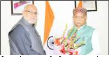
हिमाचल के भाजपा प्रभारी अविनाश राय खन्ना ने राज्यपाल शिव प्रताप शुक्ल से राजभवन में शिष्टाचार भेंट की।