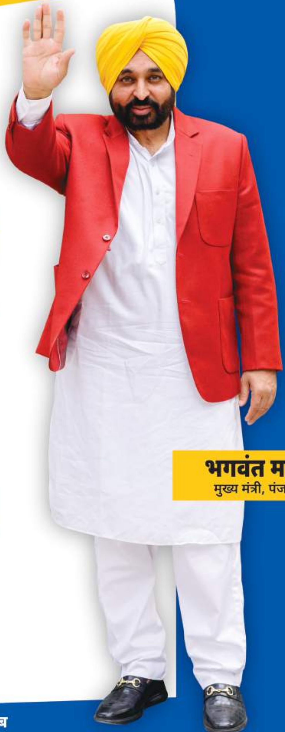
भगवंत मान मुख्य मंत्री, पंजाब