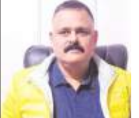
समक्ष खोली जाएंगी। आबकारी यूनिट में भरमौर, सुलतानपुर, चंबा, कियाणी, लुणा, डलहौजी, बनीखेत, चुवाड़ी, सिहूता, तीसा व सलूणी शामिल है। इस संबंध में अधिक जानकारी के लिए उप-आयुक्त राज्य कर व आबकारी विभाग चंबा के कार्यालय में संपर्क किया जा सकता है।